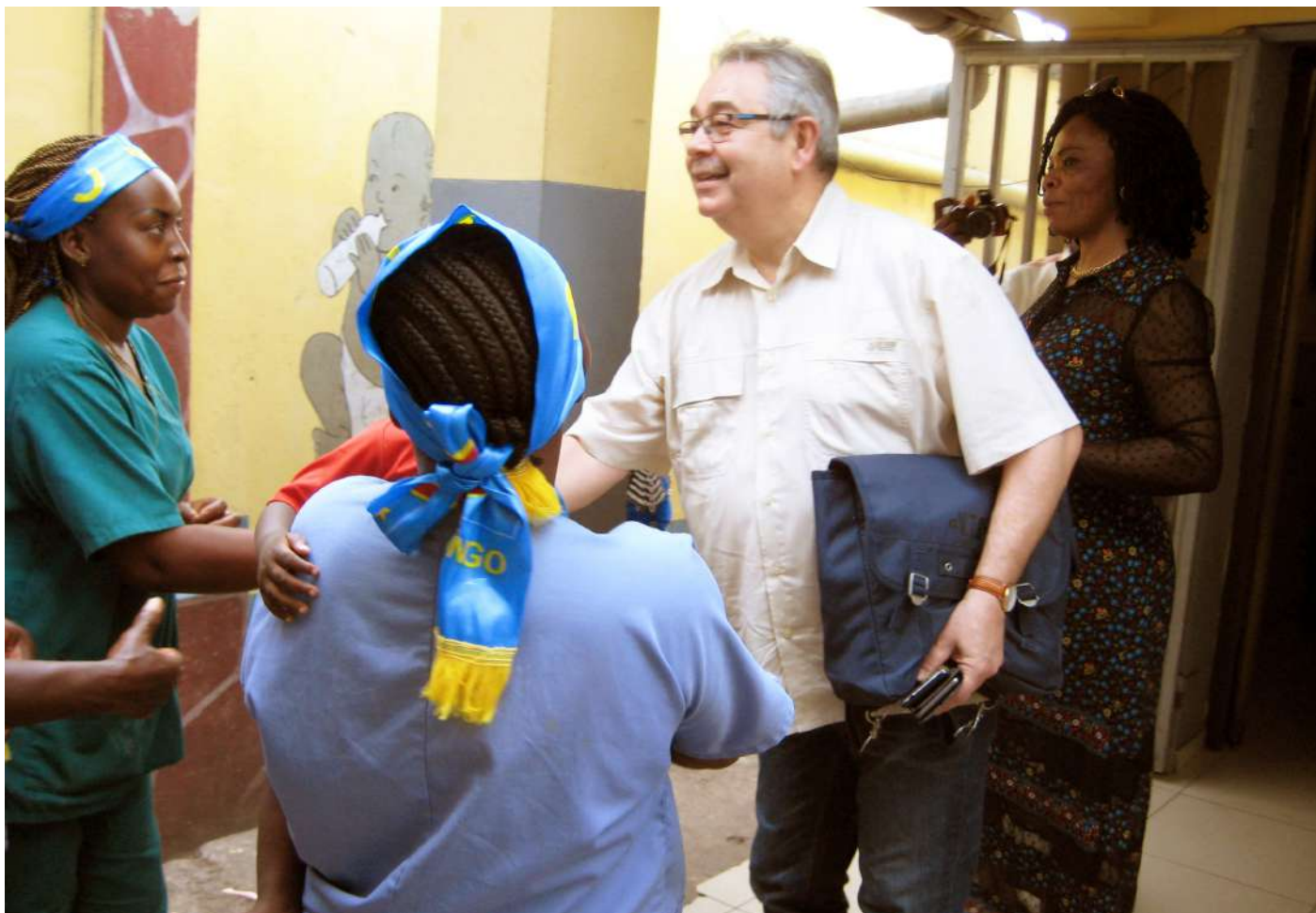
Visite du Site de l'orphelinat