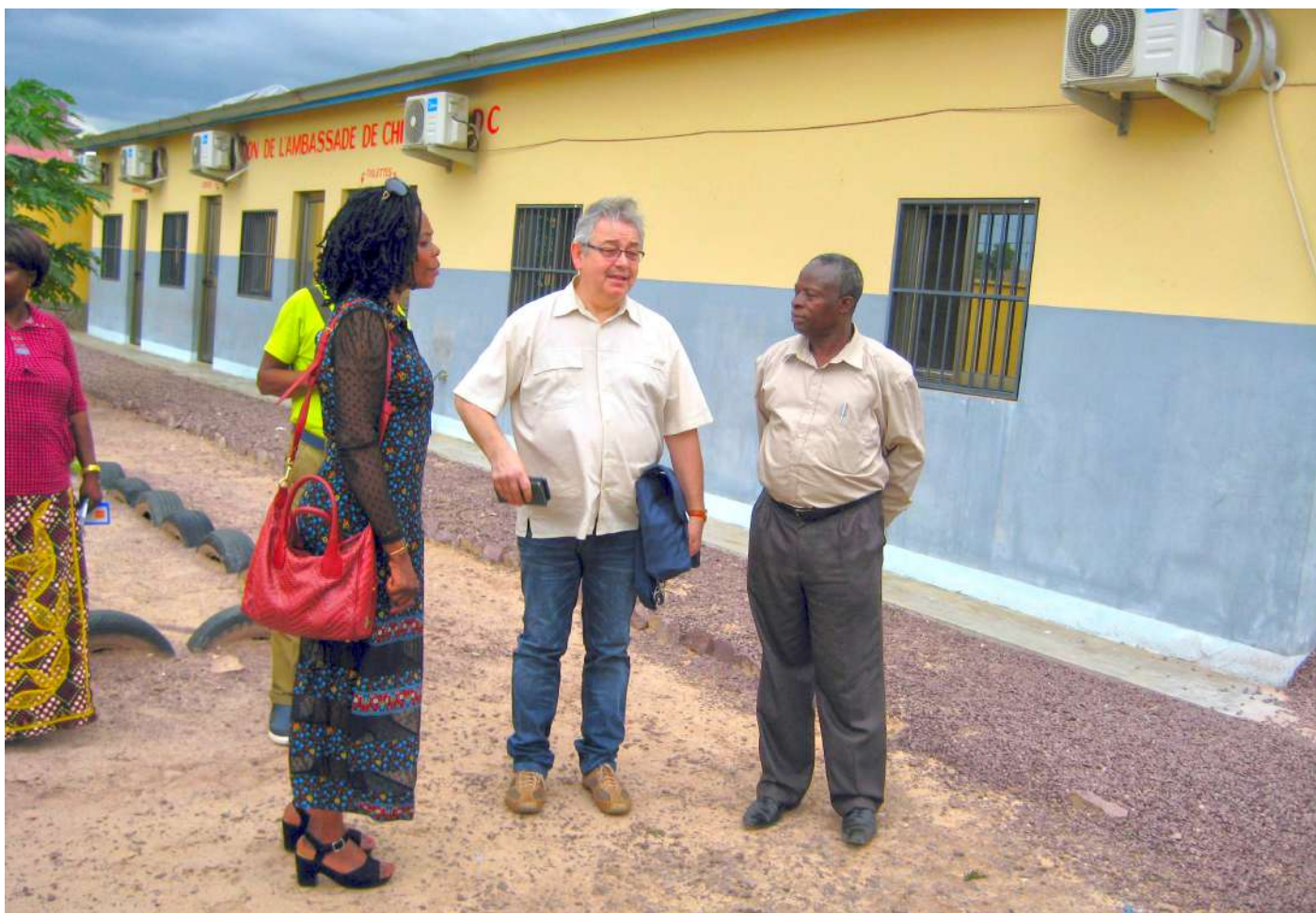
Visite de l'espace pour la construction d'un centre médical et d'une maternité