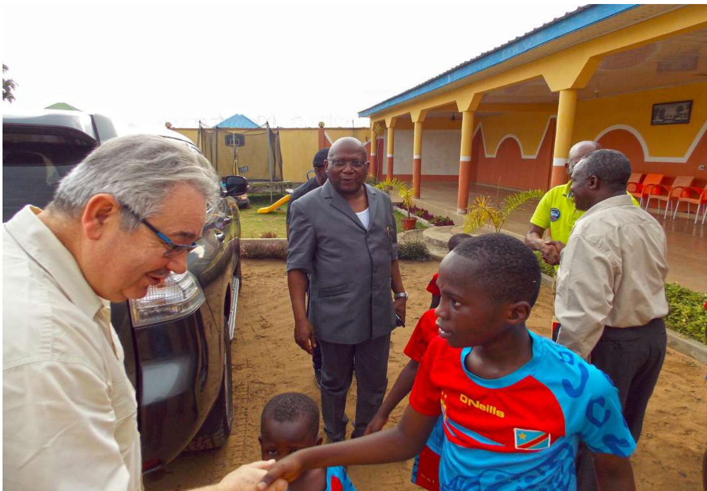
Arrivée de la délégation officielle de l'Association Solidarité Internationale / France A l'orphelinat « Sourire d'enfant »