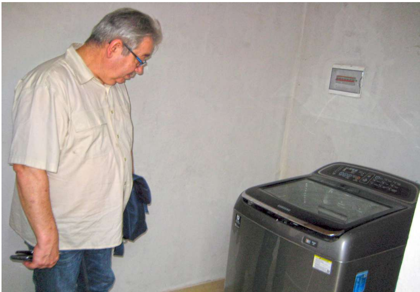
Visite de la lingerie