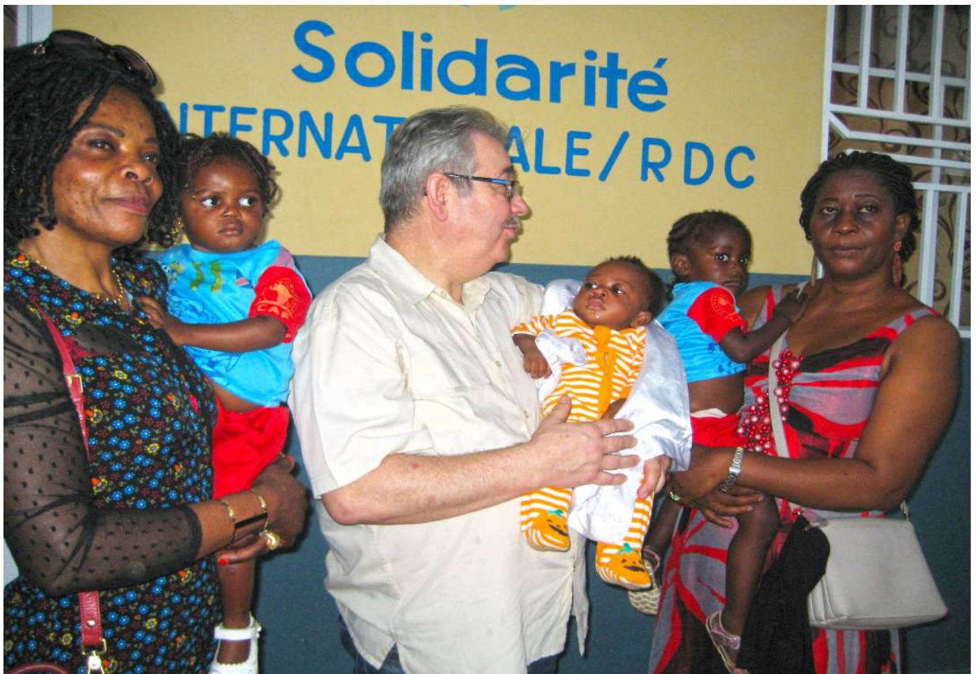
Tout enfant quelle que soit son âge et sa race a besoin de l'affection.