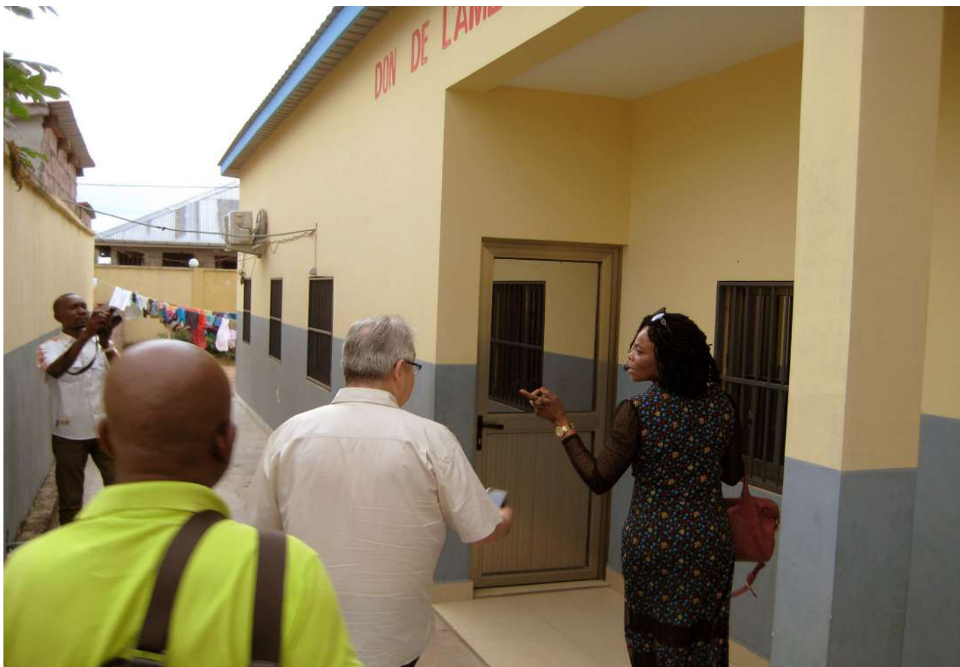
Visite de la maison II. Don de l'ambassade de chine en RDC.