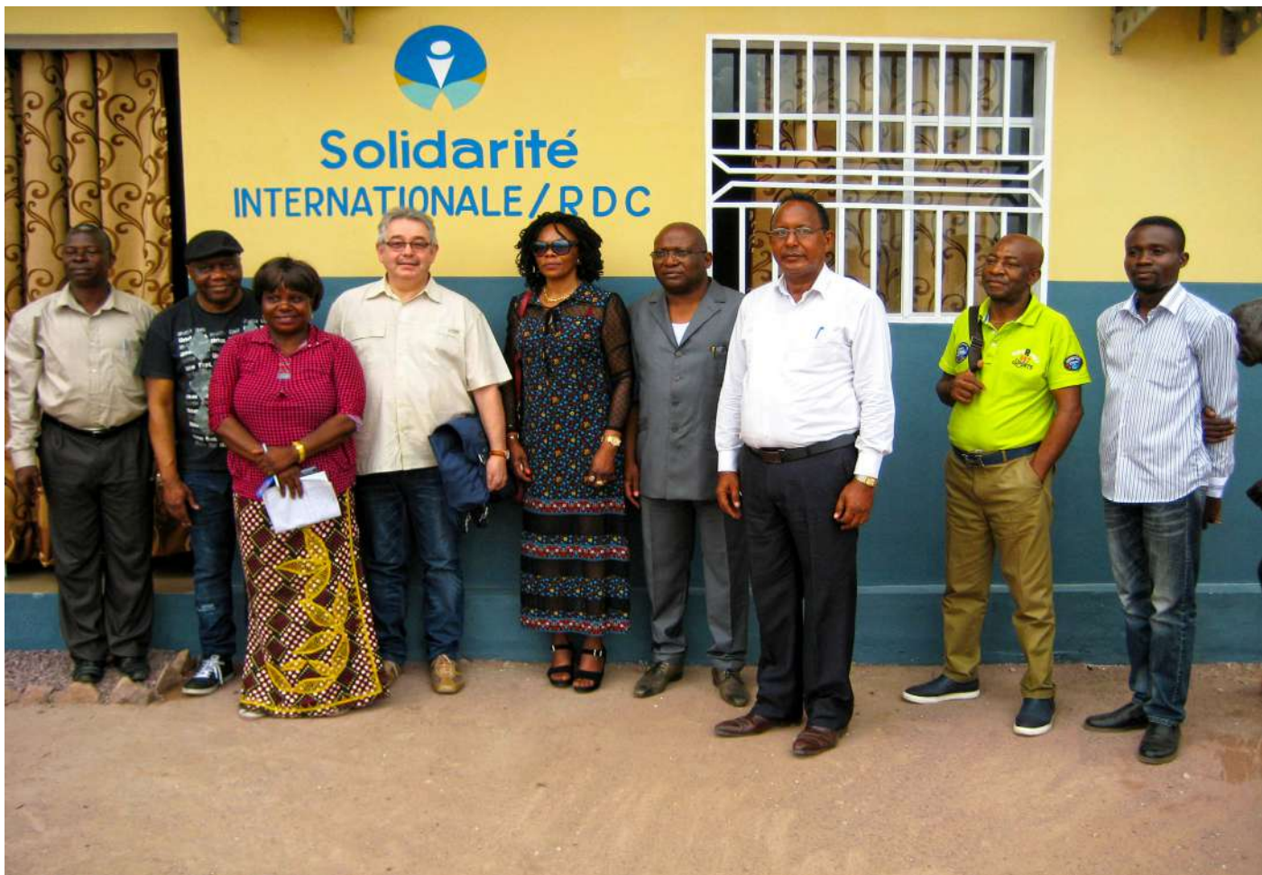
Photo souvenir du personnel de l'orphelinat et la délégation de l'Association Solidarité / FRANCE