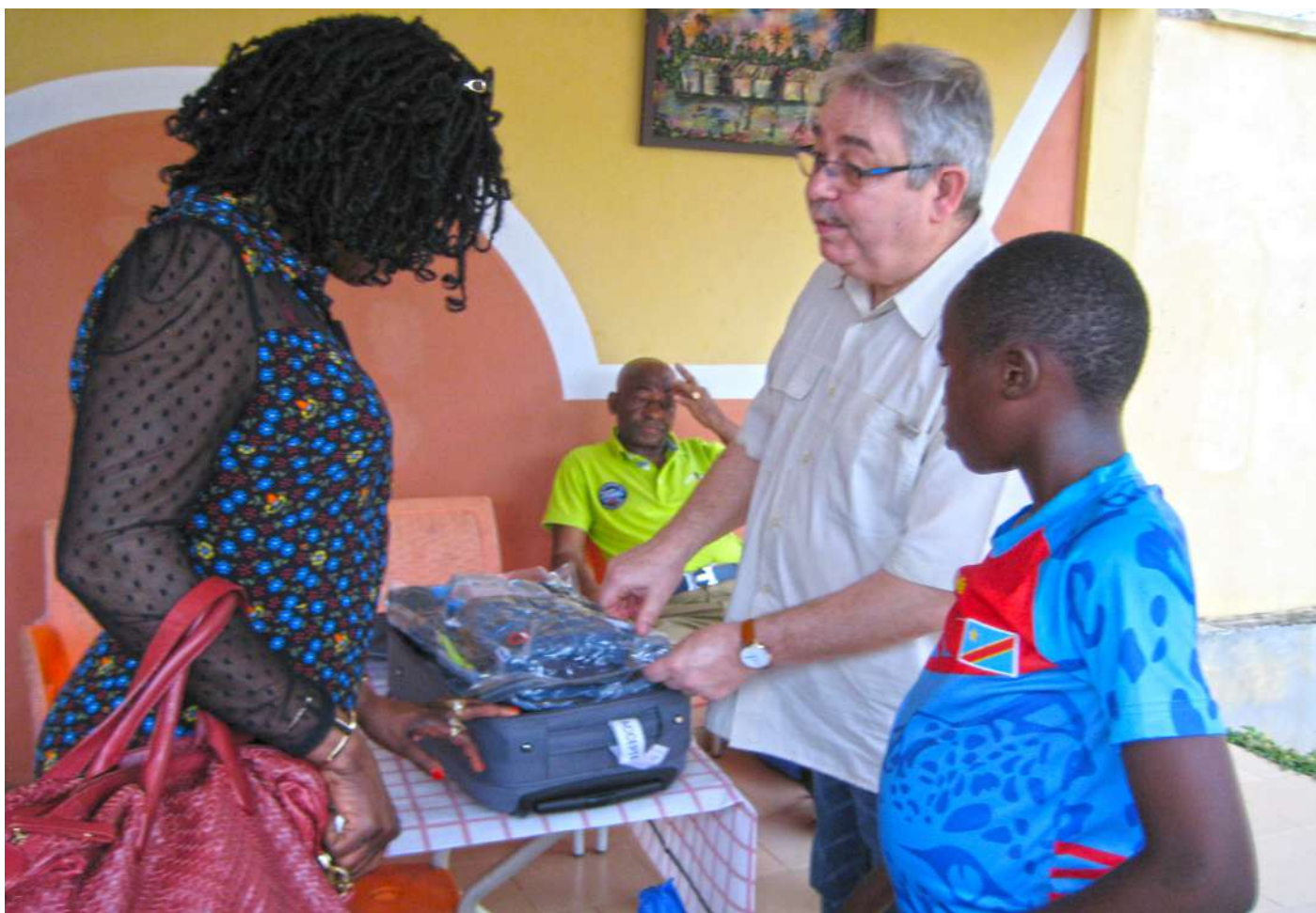
La promotrice reçoit de ses hôtes, les cadeaux pour les orphelins