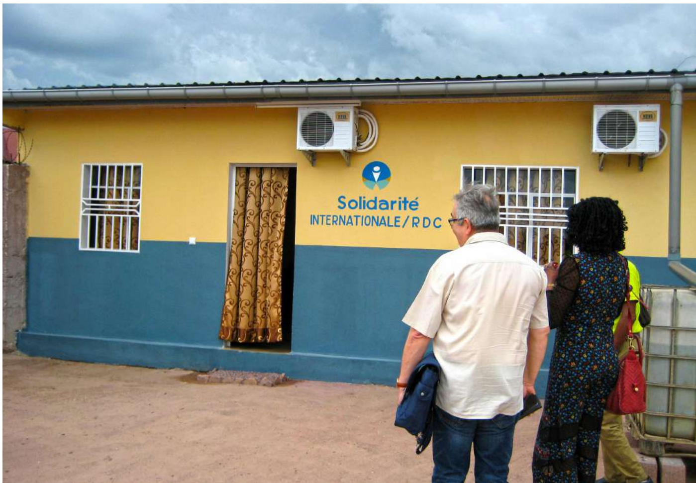
Visite du bureau de l'antenne de Kinshasa de l'Association Solidarité Internationale France