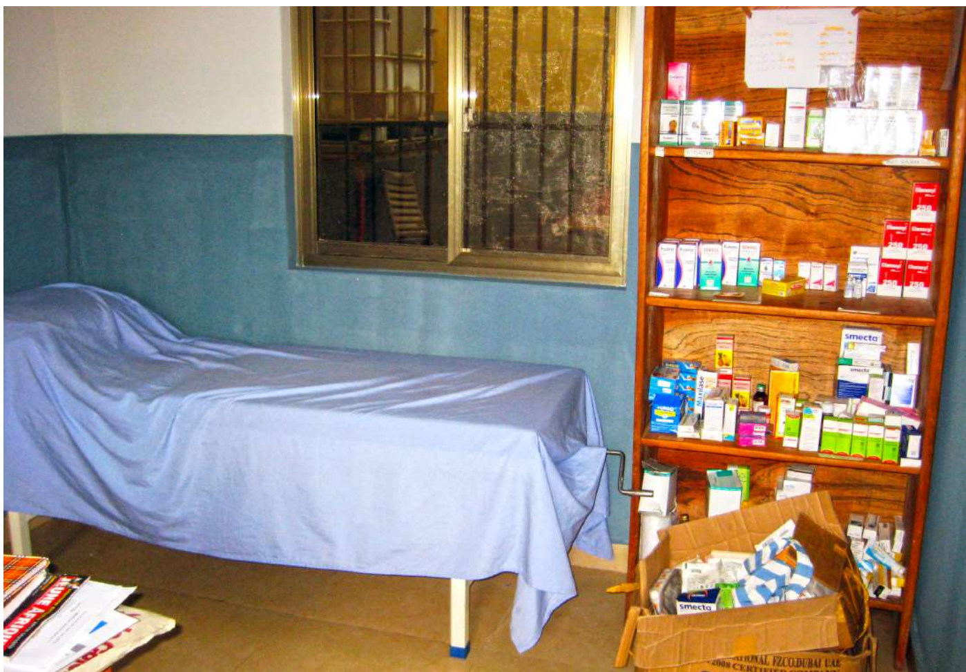
Visite de l'infirmerie et de la crèche