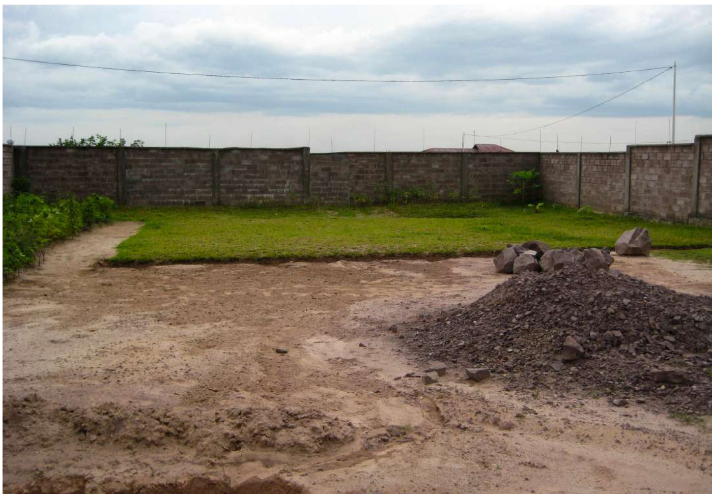
Visite de l'espace pour la construction « d'une école pour tous.» Elle sera fréquentée par les enfants de l'orphelinat ainsi que du quartier. Elle sera gratuite