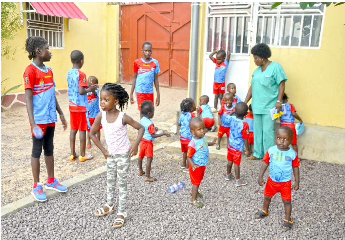
Expression de satisfaction des enfants